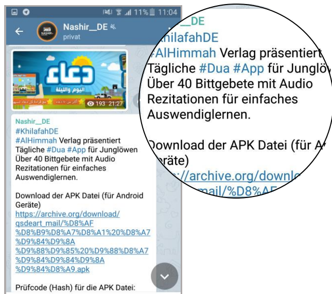
App für "Junglöwen": Download Angebot auf einem Telegram-Kanal.

Die professionelle, zielgruppenorientierte Propaganda salafistischer Gruppierungen erstreckt sich inzwischen auch auf die jüngsten Internet-User. Der "Islamische Staat" richtet sich mit mobilen Angeboten gezielt an Kinder. Die Apps sind in einfacher Sprache, bunt und bildreich gestaltet und entsprechen dem, was User heute aus dem stetig wachsenden Markt der mobilen Anwendungen gewohnt sind. Ziel ist, Kinder so früh wie möglich an die extremistische Ideologie heranzuführen und ein positives Bild vom Dschihad im Sinne des bewaffneten Kampfes zu erzeugen.