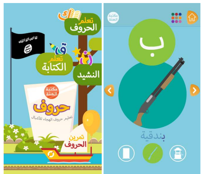
Spielerisches Buchstabenlernen: Anfangsbuchstabe (rechts) des arabischen Wortes für Gewehr.

Die IS-App "Huruf" (Deutsch: "Buchstaben") soll das arabische Alphabet spielerisch vermitteln und die Nutzerinnen und Nutzer auf den "heiligen Krieg" einstimmen. Die App richtet sich in erster Linie an Kinder, die bereits arabischsprachig sozialisiert sind.